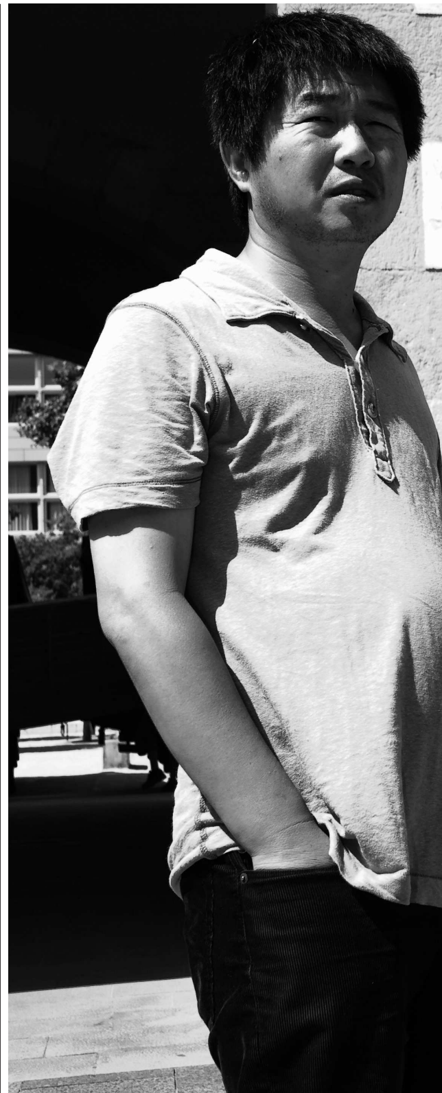
O cineasta chinés Wang Bing, ás portas do Centre de Cultura Contemporània de Barcelona